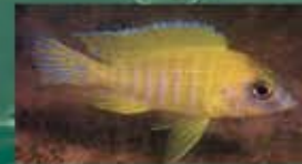
Aulonocara stuartgranti maleri